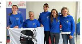
Les Mare e V'elles à Caen en Normandie.